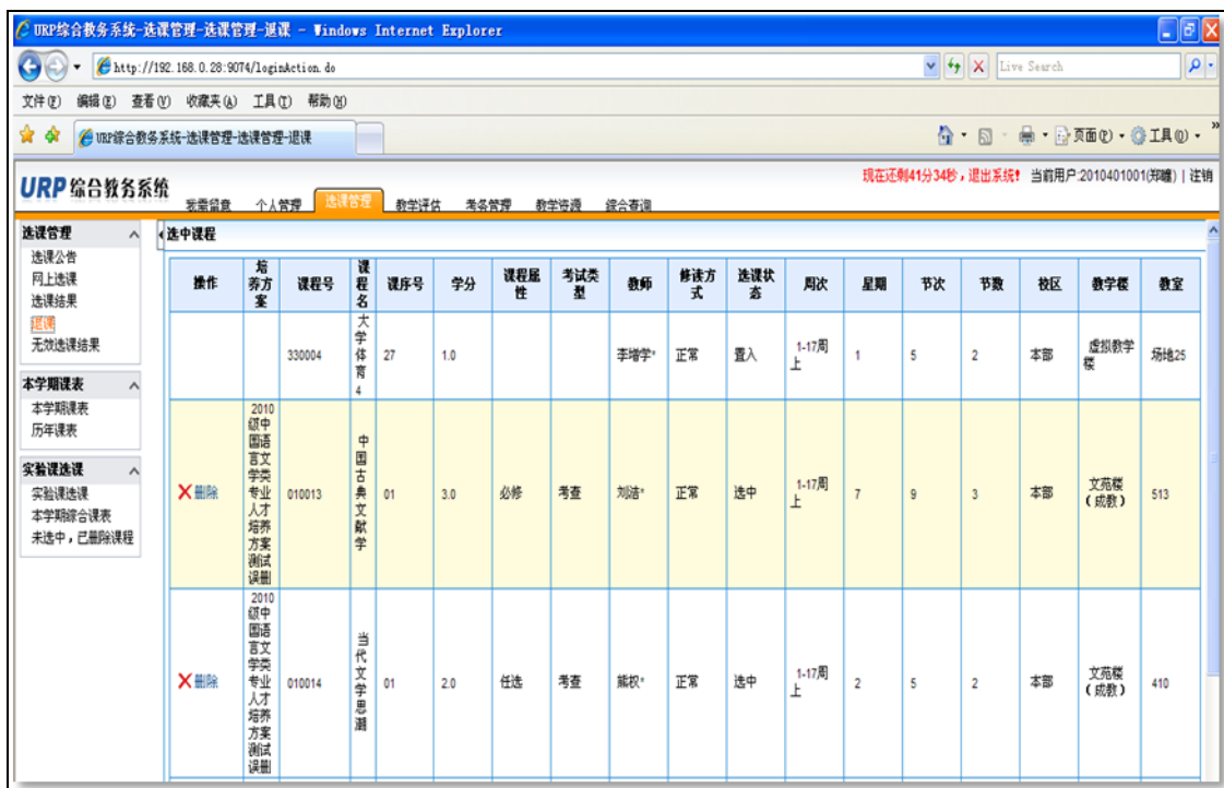
图 2.6 退课操作主界面