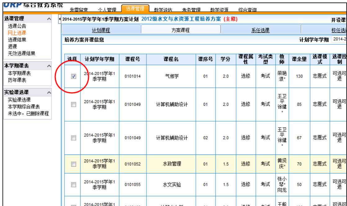
图 2.4 课程查看与选择主界面

选课前，可先点击感兴趣课程的“课程名”了解课程详细信息，选定时点击课程前“选择”列的“ ”即可（见图 2.4，无课程选择列中无“ ”的课程是教务处已经预置的必修课，请核对预置课程是否正确， 注意：公选课不得跨校区选课 ）。点击【确定】按钮会提示选课成功或是选课冲突。