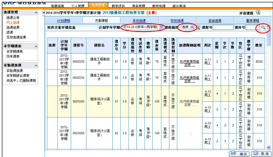
图 2.3 课程查看与选择主界面