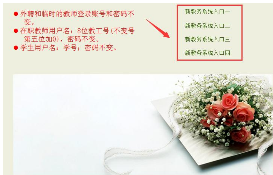
图 1.2 选课入口界面

1、在任意一台可访问校园网的计算机上点击河海大学主页右下方的“校园服务”，点击“本科生信息”后进入学生选课入口，共有 4 个入口见图 1.2。