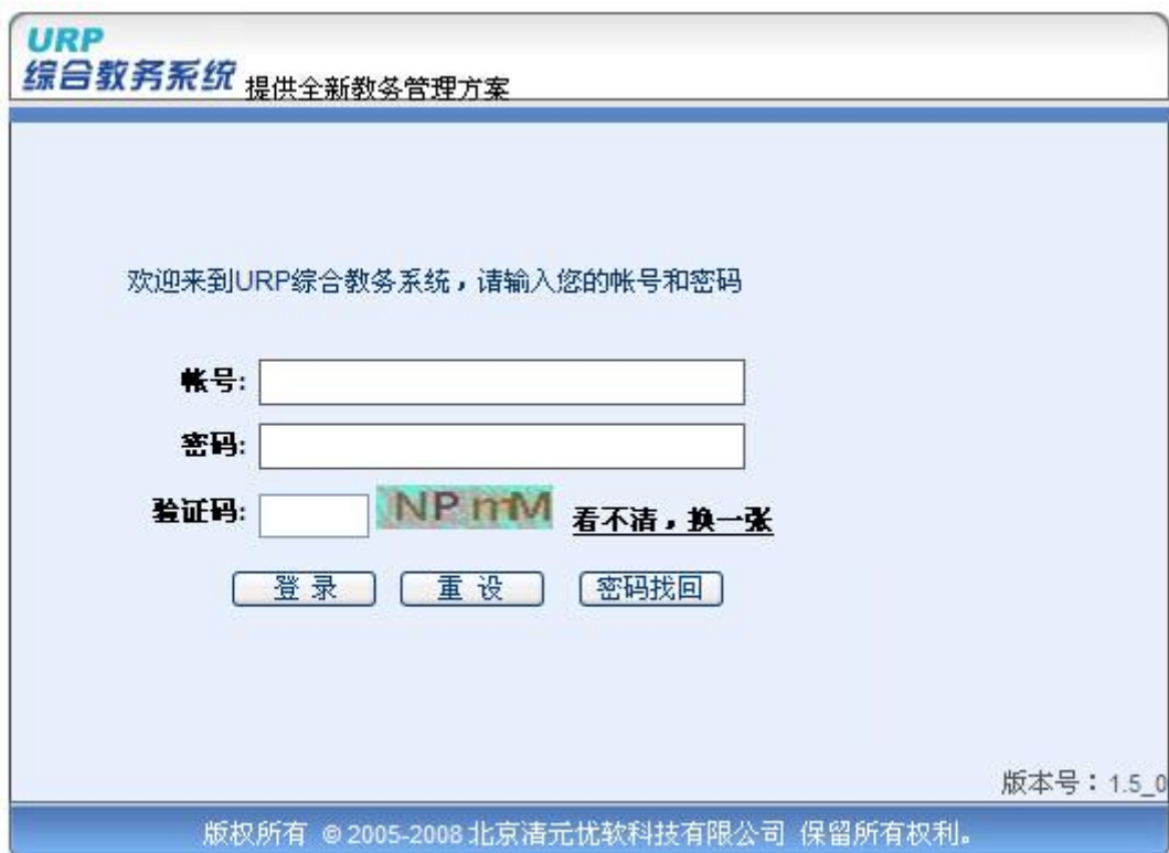
图 1.3 选课信息登录主界面

如忘记密码，请携带本人学生证至教务处学籍科重置密码。如果学生登陆后没有看到选课界面，页面提示“你没有注册，无选课的权限，请核实是否欠费！”，咨询院系辅导员或教学秘书查明缴费金额，并到财务处进行缴费或办理“绿色通道”等相关手续，并在选课时段内进行选课。