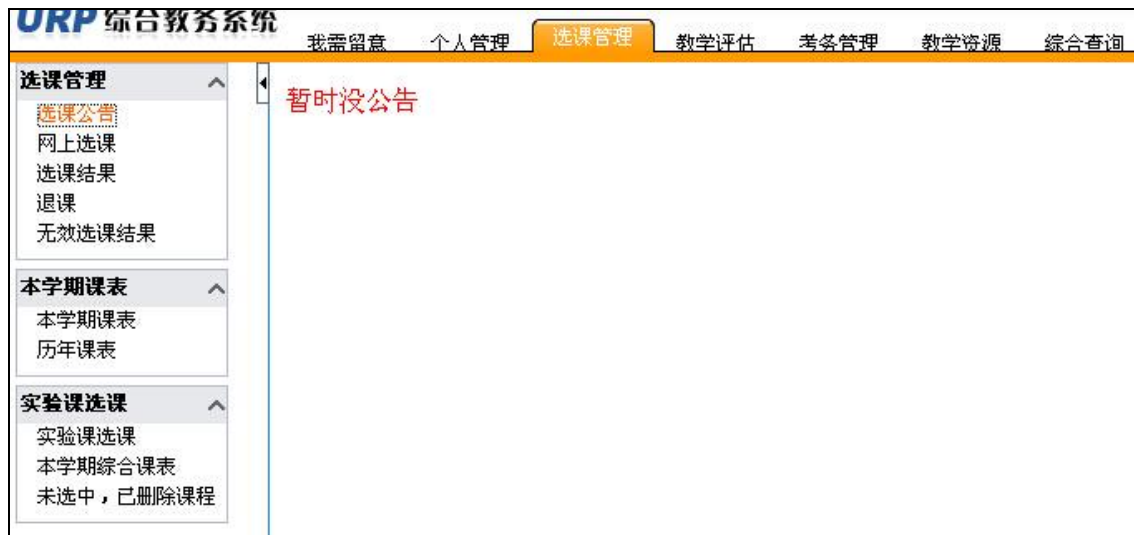
图 2.1 选课管理主界面