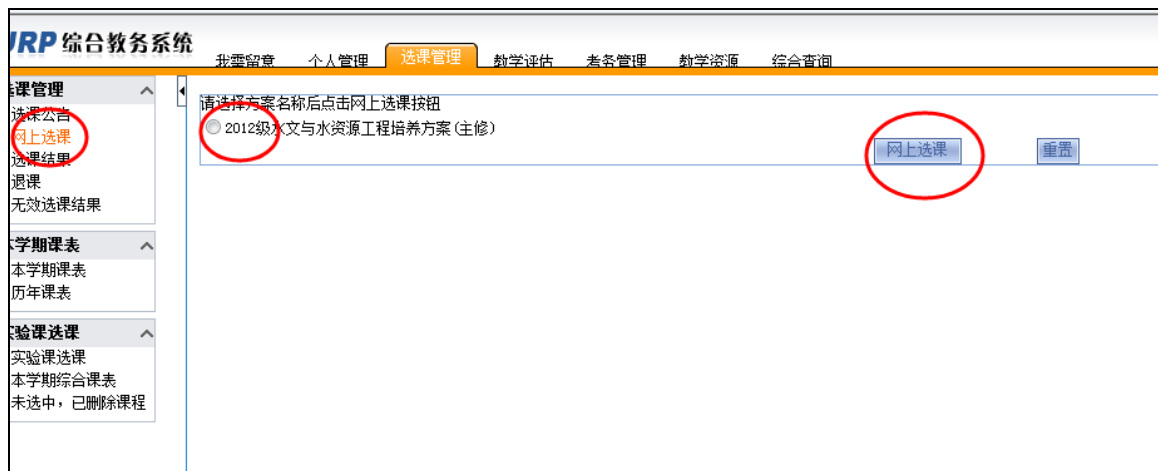
图 2.2 【网上选课】主界面

点击选课管理中的【网上选课】菜单，选择方案名称后点击【网上选课】按钮进行选课（见图 2.2）